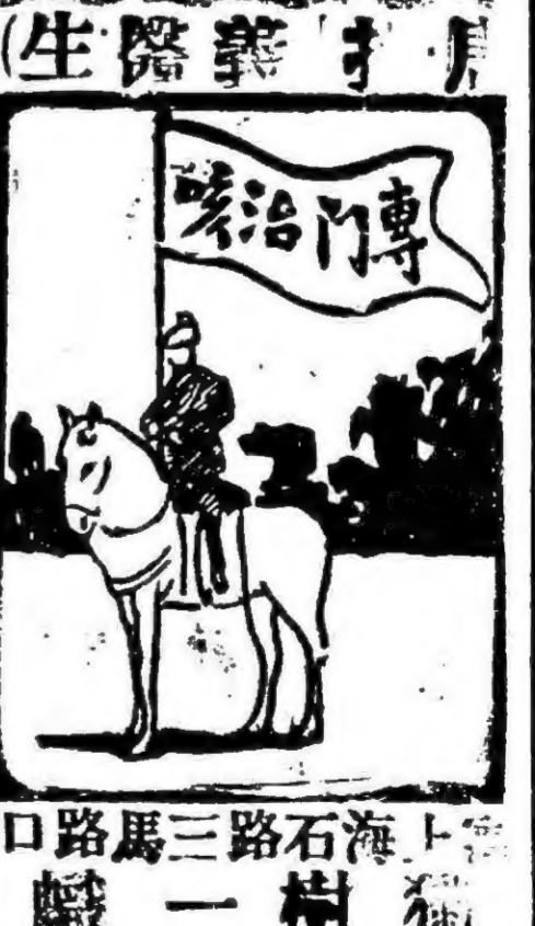
上海石路馬路口 樹一職